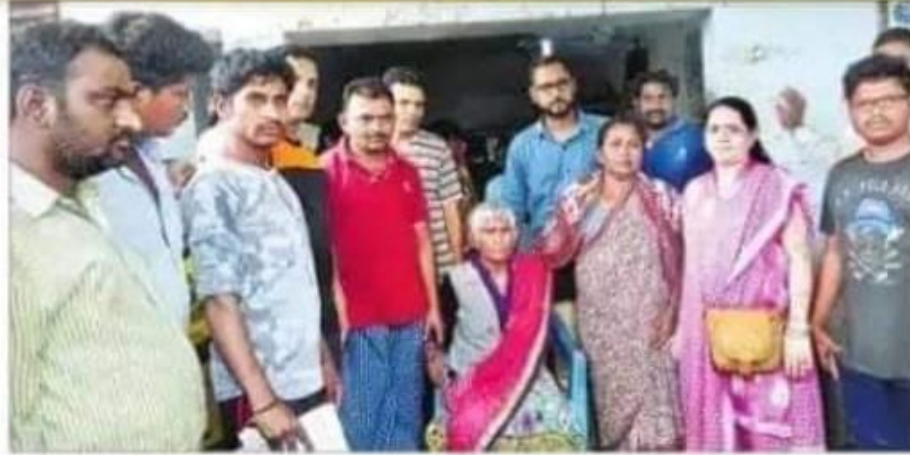
శుక్రవారం తల్లి రామకృష్ణ కుటుంబ సభ్యులకు అప్పగిస్తున్న శ్రద్ధ ఫౌండేషన్ బాధ్యులు