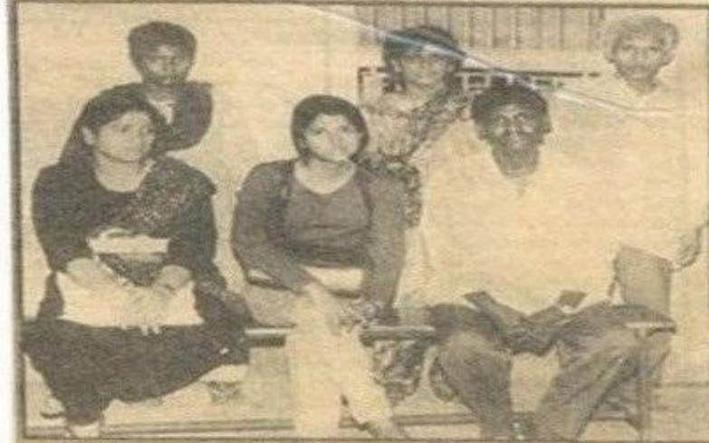
మూర్ఖుత్వవారు శ్రద్ధ ఫౌండేషన్ నిర్వహణ, నిర్వహణవారు మానసిక వికలాంగులు