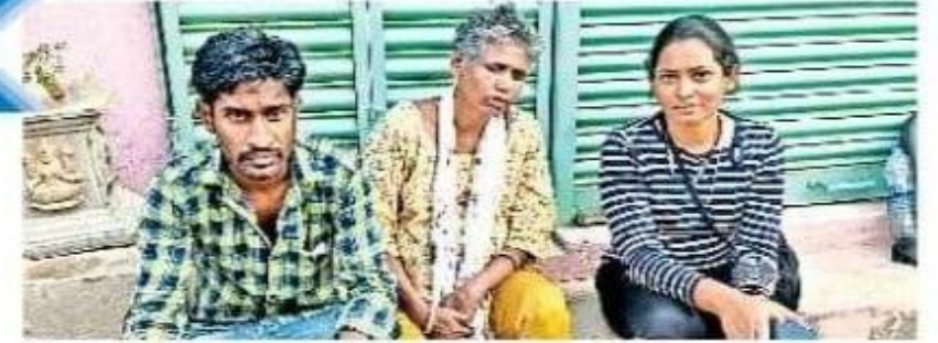
ఫౌండేషన్ ప్రతినిధులతో మహిళ