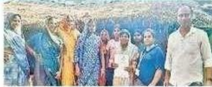
మహిళను కుటుంబం చెంతకు చేర్చిన ఫౌండేషన్ సభ్యులు

ఎన్ఎడికూడలి (బుచ్చి రాజుపాలెం), న్యూనీకుడే: జీవీఎంసీ 90వ వార్డు బుచ్చిరాజుపాలెం జీవీఎంసీ నిరాశ్రయుల వసతి గృహంలో ఆశ్రయం పొందుతున్న ఓ మహిళను